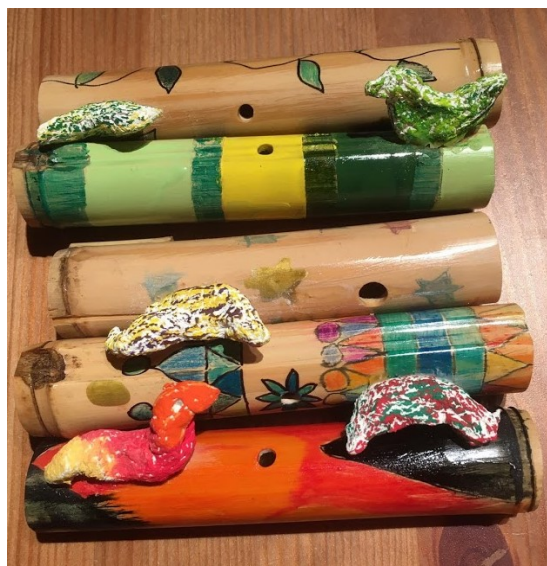
Kuckucksflöten / flûtes de coucou