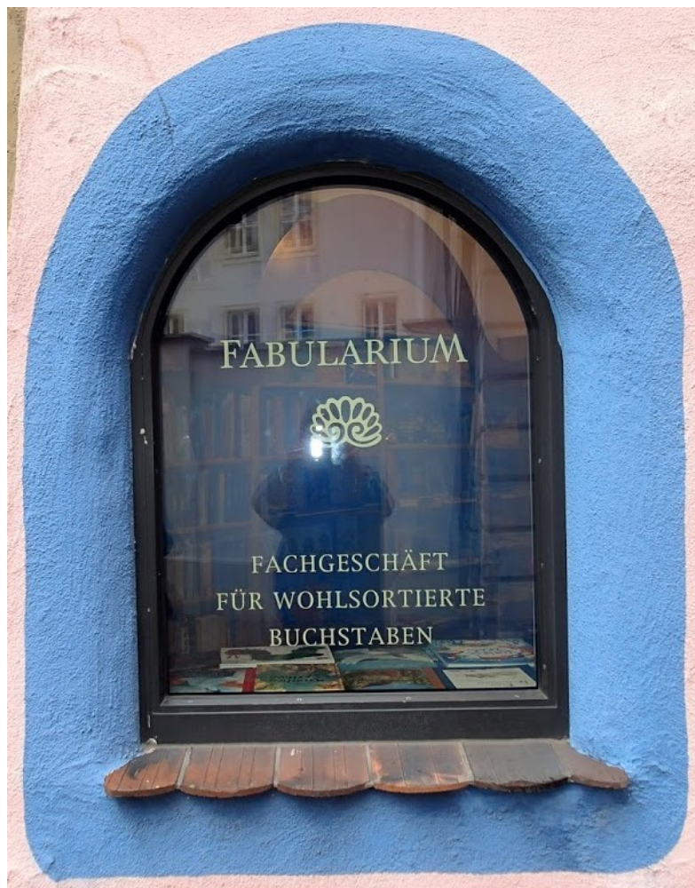
Magdeburg (D), Anschrift eines Buchladens